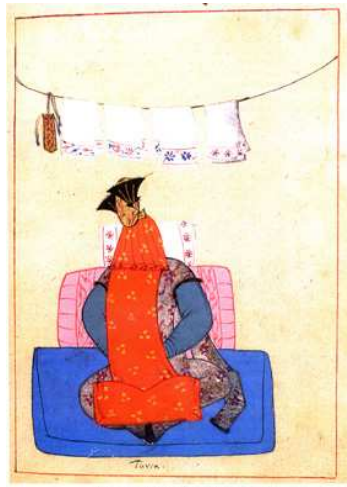
Gelin, Albüm, Deniz Müzesi 2380, y.112.