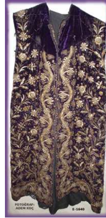
Resim- 8 Kaftan. Kütahya Çini Müzesi E-1640

Osmanlı Devleti döneminde XIX ve XX. yüzyılın ilk çeyreğinde giysi üretimi ve işlemler ev, çarşı ve saray olmak üzere üç merkezde çok yaygın bir şekilde yapılmıyordu. Bunlar arasında evlerde yapılan işlemler zengin bir kaynak oluşturmaktadır. Evlenme adetleri bağlamında geliştirilerek yapılan gelin ve damat giysileri ve aksesuarları görsel ve folklorik açıdan hazine niteliğindedir. İstanbul'daki saray atölyeleri bu alanda odak noktasını oluşturmaktaydı. Kaliteli malzeme, usta işçilik ve çeşitli üsluplarla süslenmiş işlemlerle bezenmiş değişik tasarımlarla oluşturulmuş giysi kalıpları burada ortaya konuyordu. Tören giysileri, festival giysileri, askerî giysiler ve gelin-damat giysileri vb. gibi sıralanabilecek işlemeli giysiler bu atölyelerde çalışan terzi ve işlemecilerin birlikteliği ile üretiliyordu. Çarşı ise gelin ve damat giysilerinin en önemli pazarıydı. İmparatorluğun önde gelen çarşısı İstanbul'da Kapalı Çarşı'ydı. İstanbul'u İskodra, Saraybosna, Üsküp, Selanik vb. gibi Balkan Yarımadasında yer alan merkezler izlemekteydi. (Barışta 1993) Böylece Osmanlı Dönemi giyim-kuşam ve işleme sanatının Balkanlar ve Anadolu sahasına yayılışı, dolayısıyla Kütahya'ya etkisi konusunda bilgi sahibi olabilmekteyiz.