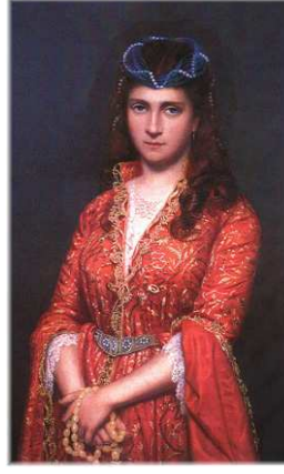
Resim- 2 Saraylı Kadın, 1875, tuval üzerine yağlıboya, Dolmabahçe Sarayı, 13/571

Halk-saray ilişkisini gözler önüne serecek olan başka bir örneğe baktığımızda, Karakeçili aşiretinden olan Domaniç Yörükleri'nden bir kadının göyneğinin yakasındaki göz (sinek) ve çengel (eğri demir) yanılarından göz (sinek) imini II. Osman'ın ve III. Murad'ın kaftanlarının iç etek ucunda da görmekteyiz. Bunu Yörükler bizim soyumuzu gösterir ve bize uğur getirir şeklinde yorumlarlar. Hatayî, rumî, pencap motiflerinin yoğun bulunduğu saray süslemelerinin yanında padişah kaftanında bu motiflerin kullanılması padişah-yörük ilişkisini semboller niteliktedir. (Babaoğlu 1983:49) Bu imler tesadüfen bir araya gelmemiştir. İki işaret de “nazara” ve “kem göze” karşı korunma anlamı içerir.