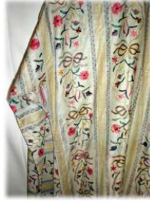
Resim- 11 Selimiye Üçetek kumaş ve işleme detayı. Kütahya Çini Müzesi E-833

18. yüzyılda işlemeli kumaşlardan yapılan elbiseler moda olmuştu. Bunlar sık dokunmuş ince pamuklulardan, seraser, kadife, atlas gibi ağır ipekliler, canfes, tafta, bürümcük gibi hafif ipekliler ile şalaki, lahuraki denilen yünlülere kadar her cins kumaş üzerine işlenirdi. Kaynaklardan “Hüseyini” denilen bu işlemeli elbiselik kumaşların 18. yüzyıl başlarında ortaya çıktığı, 19. yüzyılda daha da zenginleşip yaygınlaştığı anlaşılıyor. Dokunmuş kumaşları işleyen tezgâhlar Tepebaşı ve Galata’daki atölyelerde bulunuyordu. Bu yüzden Hüseyini işlemeli kumaşlar kaynaklarda “Tepebaşı” 7 ve “Galata işi” olarak da geçmektedir. Ancak işleminde tel kullanılan bu kumaşlar fazla miktarda metal tüketimine yol açtığı için sık sık yasaklanmıştır. (Tezcan 2002:408)