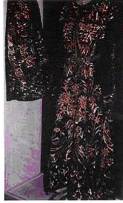
Resim- 7 Tiran Müzesi'ndeki bindallı ve ceket.

Osmanlı Devleti döneminde giysilere (Osman Hamdi 1873) ve ev eşyalarına yapılan işlemlerin Türk sanatı içinde önemli bir yeri vardır. Bölgeden bölgeye, yöreden yöreye kolay taşınabilir nitelikte olması diğer el sanatları gibi bu sanat dalına da ayrıcalık kazandırmaktadır. Her yörenin işlemleri özgün bazı özellikler yansıtmasına rağmen türlerin biçimi, seçimi, uygulanan teknikler ve süslemede gözlenen üsluplamalar açısından bazı benzerliklere rastlanabilmektedir. Resim-7'deki Tiran Müzesi'nde sergilenen bindallı ve ceket Müslüman Türk halkı tarafından gelinlik olarak giyilmekteydi. Resim-8'de gösterdiğimiz kaftana Kütahya Çini Müzesi'nde E-1640'ta rastlamaktayız. Benzer motifler dikkat çekicidir.