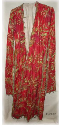
Resim- 9 Süpürgeli Pullu Üçetek Entari. Kütahya Çini Müzesi E-2422.

Saray, hanedanlık rengi olarak kırmızı rengi benimserken, halk kırmızının yanı sıra mor, mavi, pembe gibi canlı renkleri tercih ediyordu. Gelinin yüzünü örten duvak kırmızı idi. 1870'lerden sonra Batı etkisiyle daha açık renkte gelinlikler giilmeye başlandı. Beyaz kumaştan gelinliği ilk kez 1898'de Kemalettin Paşa ile evlenen II. Abdülhamid'in kızı Naime Sultan giydi. Sarayda başlayan ve zamanla yaygınlaşan beyaz gelinlik 20. yüzyılda vazgeçilmez oldu. (Gül 2002) Buradan hareketle sarayın halk giyim-kuşamını doğrudan etkilediğini açıkça söyleyebiliriz.