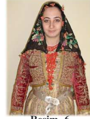
Resim- 6 Kütahya Merkez Bölcek Köyü baş bağlama şekli.

Kullanılan tepelik, alınlık, kemer aynası, kemer kaşı, yağlık, tülbent, hamaylı, uçkur, peşkir gibi giysi parçalarında yaptığımız incelemelerde dini motiflerin yanında diğer inançlar sisteminin de etkili olduğunu gördük. Bu noktada Kütahya yöresinde yaşayan insanların aslında inançlarına sıkı sıkıya bağlı olduklarını görmekteyiz. Halı ve kilimler, çiniler, mimari eserlerde gördüğümüz bazı motiflerin giysi parçalarına ve süslemeler yansıtıldığını saptadık. Tepelik, alınlık, kemer aynası, kemer kaşında “Mühr-i Süleyman” 2 çok kullanılması tesadüf olamaz. Süslemenin yanında koruyuculuğuna da inanılmaktadır. Özellikle tepelik, alınlık, kemer tokası ve kaşı gözükecek yerdedir. Diğer insanların nazarlarından ve kötülüklerinden korunma amacıyla kullanıldığı düşünülebilir. Aynı zamanda motiflerin arasında serpiştirilmiş kaz ayakları ya da el, haşhaş ve özellikle cami motifine rastlamaktayız. Cami ve ayyıldız İslam inancının, el nazardan korunmanın, haşhaş bereketin simgesi olarak kullanılmıştır.