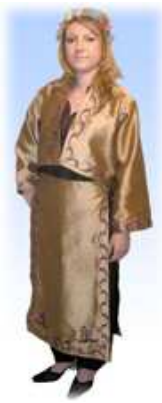
Resim- 16 Yörük kıyafetinin modernize edilmiş hali. Tuğra El Sanatları Koleksiyonu