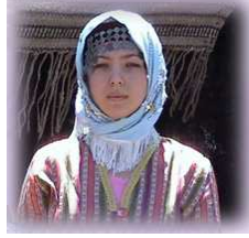
Resim- 1 Akoluk Köyü Yörük Şenliği 2003, yörük kıza baş bağlama şekli