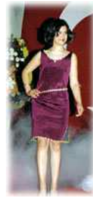
Resim- 18 Abiye. Elbise kenarlarına yerel motifler uygulanmış. Candan Çeyiz Koleksiyonu

Son zamanlarda Garanti Bankası'nın "Bonus" kart reklamı gençlerde saç modeli olarak "bonus"u doğurdu. Show TV'de oynayan "Deli Yürek" filminde Yusuf'u canlandıran Kenan İmirzalıoğlu'nun siyah kaşmir paltosu ve ne kadar olumsuz şekilde eleştirilse de Show TV'den KanalD'ye transfer olan (reyting rekorları kıran ve çok fazla reklâm alan bir dizinin başka bir televizyona transfer olması ne kadar beğenildiğinin ölçüsü olabilir) 2005 ve 2006 dönemine damgasını vuran Kurtlar Vadisi dizisinin karakteri Polat Alemdar'ı canlandıran Necati Şaşmaz ve Kurtlar Vadisi Konseyi'ndekilerin şık takım elbiseleri ve Polat'ın kravat takmadan gömleğinin iki düğmesini açarak takım elbise giyim davranışı gençler ve orta yaşlılar arasında çok tutuldu. Birçok firma bu dizilerin döneminde satışlarını katladıklarını belirtmişlerdi. Zaten piyasaya aşırı şekilde çizgili takım elbise sürülmesi ve herkesin zebra gibi dolaşması da bunu kanıtlar şekildedir. Sedat Dizman (2005), Kütahya'da bu diziler esnasında patlama olduğunu ve aşırı şekilde siyah palto ve takım elbise sattığı belirtir. Bunu fark ettikten sonra da satış planlamasını dizilere göre yapar ve yanılmaz.