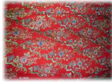
Resim- 12 Tefebaşı Üçetek Entari işleme ve kumaş detayı. Kütahya Çini Müzesi E-1805

Her toplumun kendine özgü giyim kuşam anlayışı mevcuttur. Bu anlayışın moda olarak yayılabilmesi sistemli bir yönlendiriş gerektirir. Günün şartları ve yenilik arayışı da modayı destekler. Fakat her zaman toplumun istekleri gerçekleşmez ve siyasi otoritelerin istekleri neticesinde yönlendirilirler. Osmanlı’nın çağdaş toplumsal değişimi orduyla başlamıştı. Bir zaman moda olan çarşaf demode olmaya başlar. Çarşaf ismen kalkmasa da Batı kadın giysilerinden fark edilmeyecek oranda değişime uğrar. Artık Türk kadını Cumhuriyet dönemi köklü kıyafet değişikliklerine hazırdır. (Toprak:52-63, Özer 2002:156’ dan)