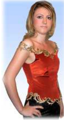
Resim- 17 Abiye. Yaka ve uçlarda yerel motifler uygulanmış. Tuğra El Sanatları Koleksiyonu