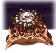
Resim- 3 Elmas yüzük. 1925’lerdeki Kütahya modası. Doğan Şapçı’nın özel koleksiyonundan.

Kütahya’da gelinin tepesi elmaslarla süslenir. Bu elmaslar kendisinde yoksa bile akrabalarından ya da ona güvenen çok yakın komşu ve dostlarından alır. Kına gecesinde mutlaka takar. Ayrıca geleneğine bağlılığı göstermek için babasından kalan ya da babasının yaptırdığı elmas yüzüğü (Resim-3) takar. Bu yüzüğü şehir dışından gelip yaptıranlar da vardır. Onlar da Osmanlı soyundan geldiğini göstermek için bunu tercih etmektedirler. Gelenek olarak ömür boyu kullanılır. Kız, torun, geline devreder. En iyi armağandır elmas takılar. Kütahyalı gelinler Tefebaşı adı verilen gelinliğin bütünleyicisi olarak elmas takıları mutlaka takarlar. (Şapçı 2005) Ancak maliyeti yüksek olan bu yüzüğü günümüzde alamayan Kütahya halkının, elmas yerine ucuz taştan imal edilmiş aynı motifleri içeren yüzük ve broş tercih ettiği gözlemlenmiştir.