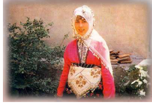
Resim- 4 Domanıç Yörük gelini baş bağlama şekli

kesinlikle herhangi bir nesne kullanılmadan dane kulakların arkasından kısıtırılır ve kâkül gözüdür. Bekâr bayanlar daneyi kâkülleri gözükecek şekilde tepelerine bırakırlar. Kulakları gözükmaz. (Resim-6) Civar yerlerde fes üstüne tutturulur, başa bağlanır ve tepelikle başa kondurulur. İlçelerde ve kırsalda fes üstüne tülbent bağlanır. (Resim-4,5)