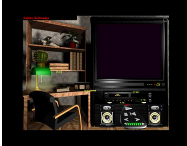
(Bilgisayar ya da vcd’deki çoklu ortam “Masal Bahçesi” ekranı)

Ön okuma aktivitesinde ilk olarak, “ Masal Bahçesi ” 13 isimli multimedya audio cd’den bir masal izletilir. Olayın çocukların zihninde yer edinmesi sağlanır. Masalın kahramanları belirlenir ve seçilmiş örnek metne geçiş yapılır. Görsel ve işitsel bir multimedya materyali olan audio cd çocuğun görsel olarak bir televizyon ekranını uzaktan kumanda ile yönetmesi ile çalışır. Çocuk istediği masala elindeki kumanda ile ilerleyebilir, sesi azaltıp çoğaltabilir. Bu tür çoklu ortam (multimedya) sağlayan cd’ler, derse giriş için mükemmel bir motivasyon yaratır. Masal Bahçesi isimli bu multimedya audio cd’si çocuklara eğlenceli ve öğretici zaman geçirme imkânı verir.