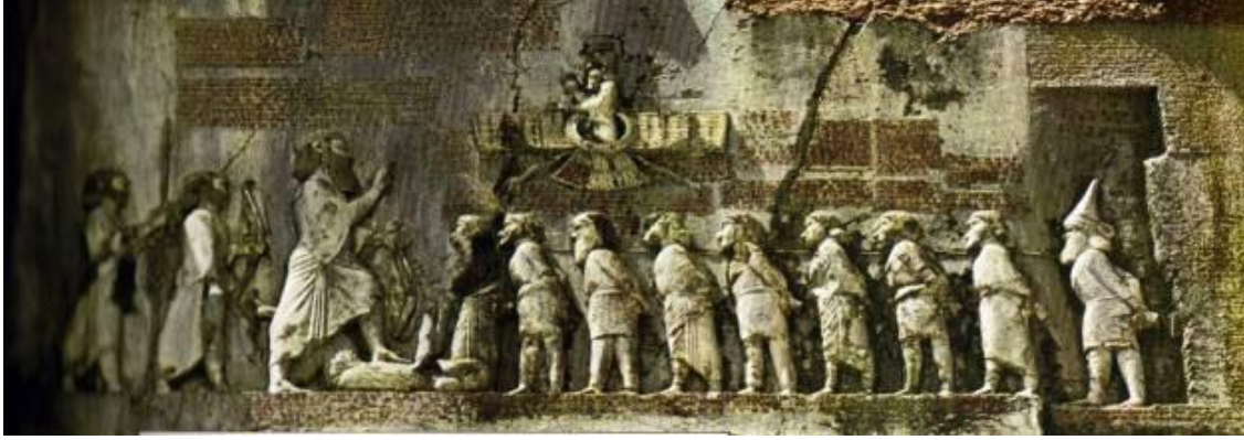
Şekil 3: Bisitun Yazıtı: http://www.cais-soas.com/News/2004/August2004/16-08.htm

Pers İmparatorluğu M.Ö. 331 yılında Büyük İskender tarafından yıkılmıştır. İmparatorluğun yıkılmasının başlıca nedeni satraplıkların özerk olması ve imparatorluğun serbest şekildeki federasyon yapısı olmuştur. Pers İmparatorluğu'nun yıkılmasına rağmen devlet yönetimindeki işleyip bozulmadan devam etmiştir, bunun yanında hükümdarın Ahameniş soyundan gelme geleneği meşruiyeti sağladığı için Büyük İskender Pers İmparatorluğu'nu fethettiği zaman Ahameniş soyundan gelen biriyle evlenerek bu meşruiyeti sağlama amacı gütmüştür.