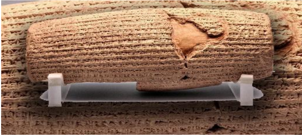
Şekil 2: Kiros Silindiri: http://www.iranchamber.com/history/cyrus/cyrus_charter.php

Kiros'un Med krallığını almasıyla başlayan süreç Babil'in fethiyle devam etmiştir. Babil halkının meşruiyetini kazanmak için Babil tanrısı olan Madruk'un vekili olduğunu söylemiştir. Kiros bu dönemde sürgünde olan topluları yerlerine yeniden yollamıştır ki bunlardan bir grupta Yahudilerdir. Daha sonraki zamanlarda Yahudiler tarafından Kiros kutsal kitaplarında "Tanrının meshettiği insan" olarak anılacaktır (Garthwaite, 2011, 27).