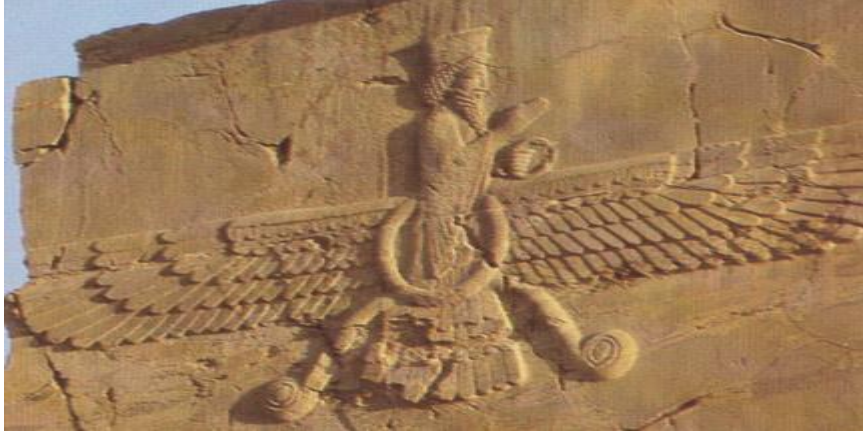
Şekil 4: Ahura Mazda Figürü: http://commons.wikimedia.org/wiki/File:AhuraMazda-Relief.jpg

Zerdüştlük dinine göre kötü olan her şey Engermeinu'nun bir parçasıdır, iyi olan her şey ise Spentameinu'nun bir parçasıdır (Şeriati II, 2010, 194). Bu iki olgu sürekli savaş halindedir. Hesap gününe kadar bu savaş sürer iyi olanlar Övgü Evi'ne (Cennet), kötü olanlar ise Yalan Evi'ne (Cehennem) gideceklerdir (Sarıkçıoğlu, 2011, 113). Zerdüştlük dininin dünya görüşü; hayır ve şerrin varlığa ve bütün zerrelere hakim insanüstü iki gücü arasındaki evrensel savaşın varlığı üzerine dayalıdır. Bu ikili yapı tüm yapıyı iki zıt kutba bölüyor.