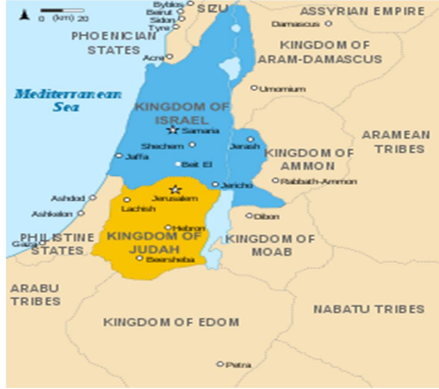
Şekil 6: İsrail ve Yahuda Krallığı: http://en.wikipedia.org/wiki/Kingdom_of_Judah

Krallığın zirveye ulaştığı dönem Mezopotamya'daki karışıklıklar dönemine denk gelmiştir ve Süleyman'ın M.Ö. 935'te ölümüyle krallıkta çöküş başlamıştır (Roberts, 2011, 118). Krallıkta başlayan ayaklanmalar neticesinde krallık ikiye bölünür. Bunlardan biri İsrail Krallığıdır ve on kabilenin bir araya gelmesiyle oluşmuştur, güneyde ise Yahuda ve Benjamin kabilelerinin birleşimiyle Yahuda krallığı kurulur ve bu krallığın merkezi Kudüs'tür (Sarıkçıoğlu, 2011, 221).