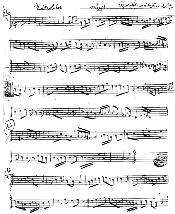
Şekil 3. I. Mahmud'un Dertli Uşşak Peşrevi

Osmanlı-Türk Müziği'nde padişah bestekârlar denildiği zaman, belki de ilk akla gelecek şahsiyetlerden biri gerek tanbur ve ney icracılığı, gerek terkip ettiği makamları, gerek besteleri, gerekse müzik teorisi çalışmaları ile III. Selim'dir (1789-1807). Kıvrımlı Hâfız Ahmet Kâmil Efendi, Kemani Âmâ Corci, Musahip Kemani Hızır Ağa, Ortaköylü bestekâr Tanburi İsak'tan yetişmiş olan III. Selim devlet düzeni ve batılılaşma hareketiyle uğraşırken, bir yandan da müzik alanında yeni bir çığır açmıştır. Döneminin ünlü bestekârları Vardakosta Ahmed Ağa, Arif Mehmed Ağa, Abdülhalim Ağa, Sadullah Ağa, Küçük Mehmed Ağa gibi üstatlar ile ortak fasıllar besteleyerek bu geleneği yerleştiren III. Selim'in günümüze 1 ayin, 1 durak, 1 tevşih, 2 ilâhi, 12 peşrev, 11 saz semaisi, 1 kâr, 10 beste, 10 semai ve 204 şarkısının ulaştığı bilinmektedir.