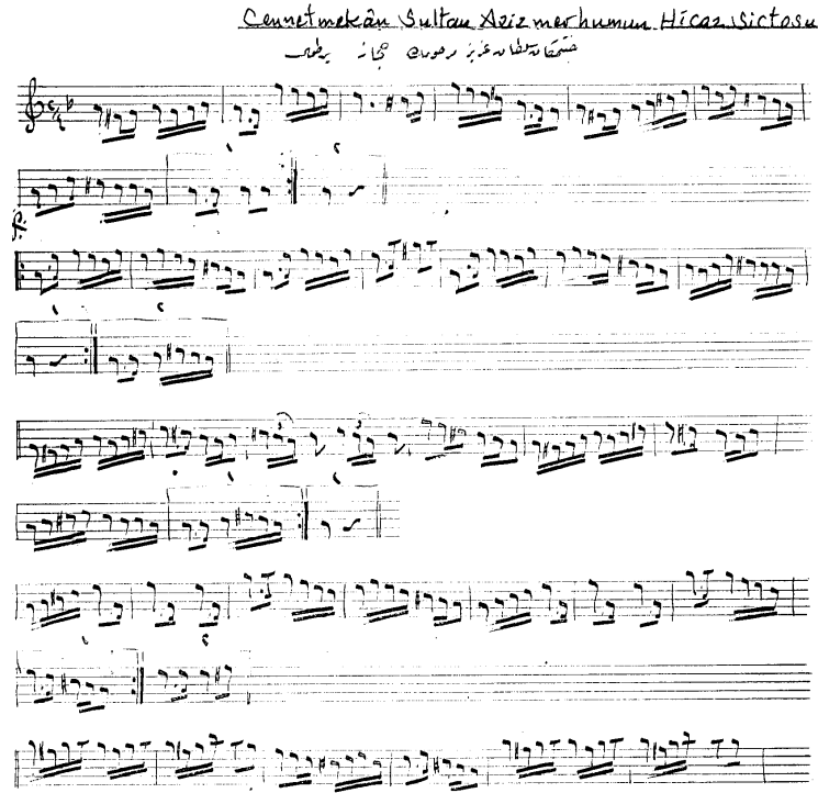
Şekil 6. Abdülaziz'in Hicaz Sirtosu

Müziği ile yakın ilişkisini kanıtlamaya yeterlidir. Şekil 7'de Abdülaziz'in Hicaz Sirtosu görülmektedir.