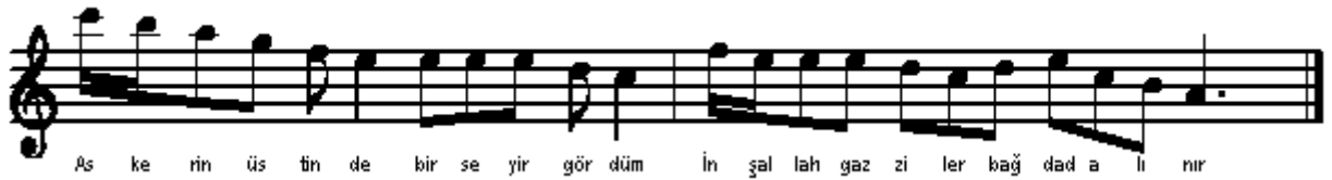
Şekil 4. Türki Berây-i Seferi Bağdad (Cevher, 2002: 372, Elçin, 1976: 94)

Askerin üstünde bir seyir gördüm Alioğlu duâ it Sultan Murâda İnşallah gâziler Bağdad alınır Bir günü bin eylesün hem ömrü ziyâde İmâm Â'zam türbesinin üstünde Şahına kuvvet eyle geldik Bağdâda Ezânlar okunur namaz kılınır Eksiklik kimdedir şimdi bilünür Kahraman beyleri askerin derer Kimi şehid olur murâda erer Osmanlı şahindir üstüne konar Şahin pençesine giren yolunur