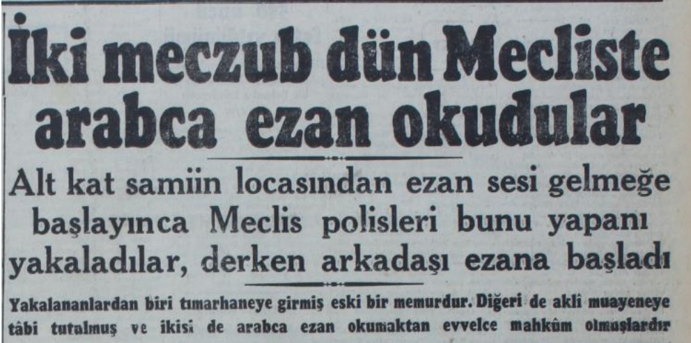
Resim 1: 05 Şubat 1949 tarihli Cumhuriyet Gazetesi'nin haberi. Hem "mezczub" ifadesi hem de küçük harfle başlatılan "arabca" sözcüğü, o zamanlar dine olan bakış açısını ortaya koymaktadır.

CHP bünyesindeki üyelere çıkan ve aslında birçok alanda CHP'den çok da farklı politikalar izlemeyen Demokrat Parti 1950'de iktidara geldikten sonra, daha önce Türkçülük hareketinin bir parçası olarak Türkçe okunmaya başlanan ezanın Arapça okunmasına geri dönmüştür. Bu dönemde devlet radyolarında Kur'an da okunmaya başlanmıştır. Ayrıca Demokrat Parti'nin CHP'yi "dinsiz" veya zaman zaman Marksizm'e göz kırpan siyasaları nedeniyle "komünist" ilan ettiği ve kendi dönemlerinde açılan cami ve imam hatip okullarının sayısının çokluğundan bahsettiği bilinmektedir. Aynı zamanda Demokrat Parti'nin tarikatların varlığını kabul ettiği ve Nurcuların desteğini aldığı da bilinmektedir.