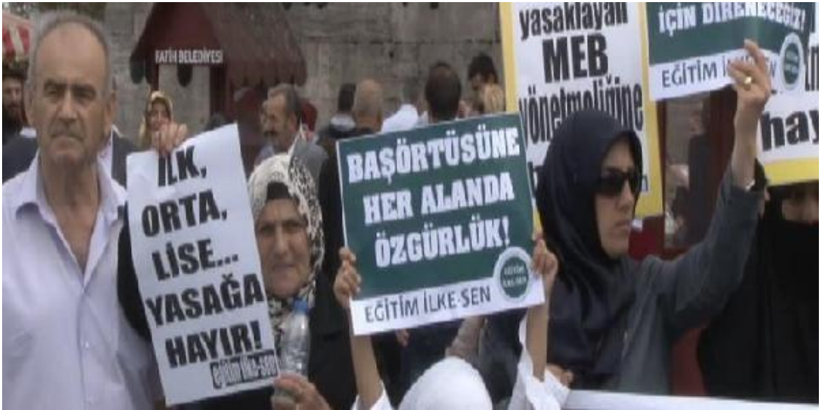
Resim 2. Eğitim İlke Sen üyeleri okullarda türban/başörtüsü yasağının kaldırılmasını istiyor

Eğitim alanından devam edilecek olursa, 4+4+4 eğitim sistemiyle birlikte imam hatip ortaöğretimi yeniden açılması göze çarpmaktadır. Önce katsayı farkının azaltılması, sonra da tamamen kaldırılması imam hatip liselerinden mezun olan öğrencilerin üniversitede İlahiyat dışındaki alanları da seçilebilmesini kolaylaştırmıştır. Bunun yanı sıra, okul tercihlerinde sisteme giriş yapmayan 45 öğrencinin otomatik olarak bir imam hatip lisesine atanmış olması tartışmalara konu olmuştur.