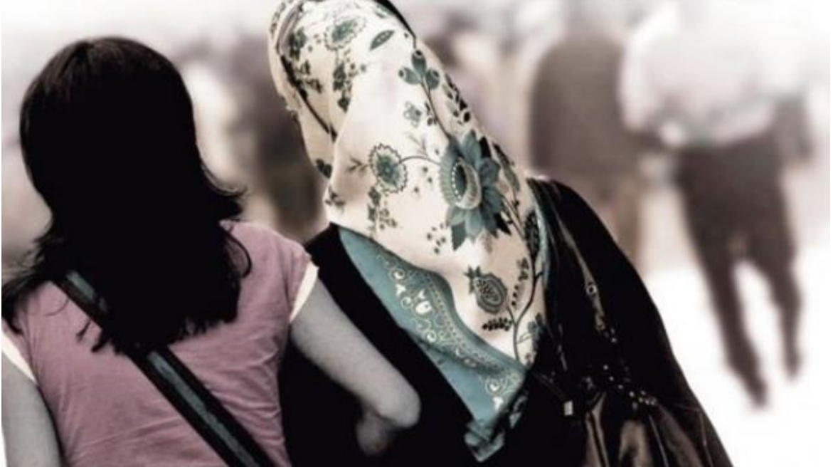
Resim 3. Türkiye, hem Batı'nın hem de Doğu'nun düşüncelerini barındıran bir toplumsal yapıya sahiptir

İslamiyet'in yalnızca bir din değil, aynı zamanda bir yönetim biçimi olması itibariyle laiklik ve İslamiyet arasında sürekli bir çatışmanın olması kaçınılmazdır. Büyük çoğunluğu Müslüman olan Türkiye'nin, bu bakımdan şeriatla yönetilen ülkelerden farklı bir konumda olduğu şüphe götürmez. Bu durum, İslamcı görüşteki kesimde genellikle olumsuz olarak yorumlanırken laik görüşteki kesimde olumlu olarak algılanır. Bu tartışma aslında bir Doğu-Batı tartışmasıdır. Türkiye, jeopolitik konumu nedeniyle hem biraz Batılı hem de biraz Doğulu ama aynı zamanda da ne tam Batılı ne de tam Doğulu olmuştur.