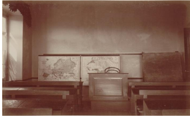
Resim 7: Yanya Hamidiye İnas Rüştiye Mektebinin İkinci Katında Bulunan Birinci Dershane 51