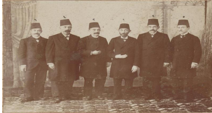
Resim 3: Yanya Hamidiye İnas Rüştüye Mektebinin İane ve İnşaat Komisyonu Heyeti 44

II. Abdülhamid dönemi okullarının mimarilerinde Avrupa etkisi görülmekle birlikte, Osmanlı gelenek-görenek ve kültürüne uygun olarak yeni baştan dizayn edilmiştir. Osmanlı okul binaları bezemeler kullanılarak, namaz ve merasim için alanlar oluşturularak, Osmanlı ve İslam geleneğinin temel elemanlarını birleştirmiştir. 45 Nitekim Yanya Hamidiye İnas Rüştüye