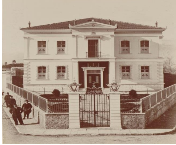
Resim 5: El İşleri Dershanesi ve Namaz Mahalli