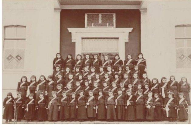
Resim 8: Yanya Hamidiye İnas Rüştiye Mektebi Talebeleri 58

Rüştiyelerde ders veren öğretmenlerin eğitim kökenleri farklıydı. Bunların bir kısmı Darülmuallimin mezunu fakat çoğunluğu medreseliydi. Okula atanan öğretmenler, “muallimin-i sani” rütbesiyle göreve başlar ve daha sonra terfi ederek “muallim-i evveliğe” yükselirdi. 59