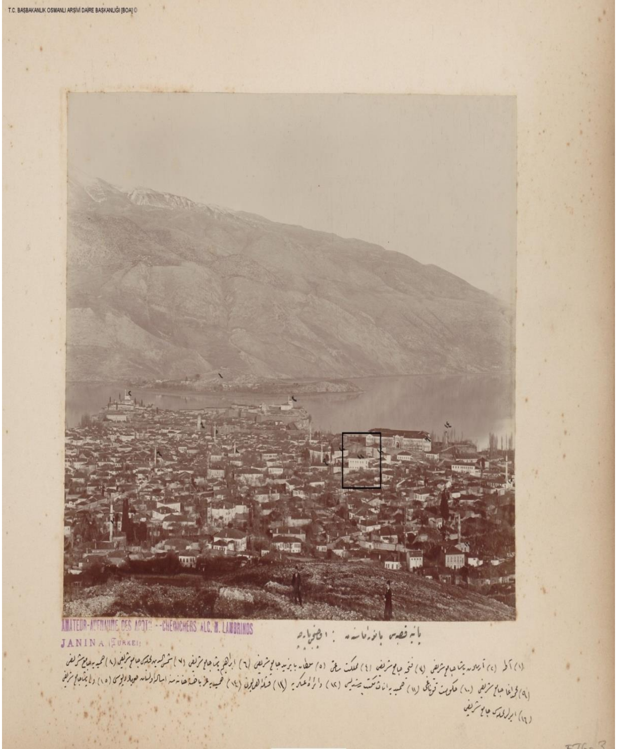
(BOA, FTG.F., Gömlek No: 3, 1912)