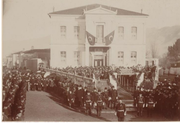
Resim 2: Yanya Hamidiye İnas Rüştüye Mektebinin Açılış Merasimi 38

1903 yılı itibariyle Yanya Vilayetindeki toplam nüfus 650.000 civarındadır. Okula giden öğrenci sayısı ise 35.650'dir. Bu rakamlardan hareketle okula giden öğrenci sayısı, nüfusun % 5.484'dünü oluşturmuştur. 39