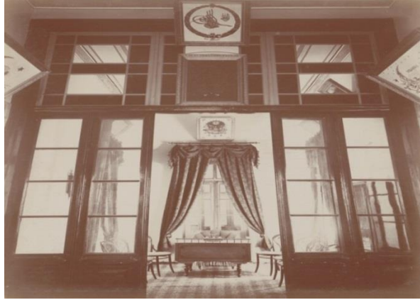
Resim 9: Yanya Hamidiye İnas Rüştiye Mektebinin İkinci Katında Bulunan Öğretmenler Odası 60

Başbakanlık Osmanlı Arşivinden Yanya Hamidiye İnas Rüştiye Mektebiyle ilgili çıkan vesikaların çoğu okulun muallimleriyle ilgilidir. Muallimlerin atanması, izinleri, zam talepleri hastalık nedeniyle tedavi için merkeze gitmeleri ve özellikle de görevlerini aksatmaları ve bu durumla ilgili yapılan tahkikatlarla ilgili pek çok kayıt mevcuttur. Osmanlı Devleti'nin genelinde, mekteplerde özellikle de kız mekteplerinde öğretmen sıkıntısı hat safhadaydı. Nitekim Yanya İnas Rüşdiye Mektebinde öğretmen eksikliğine ek olarak, öğretmenlerin görevlerini kötüye kullanmaları nedeniyle eğitimde aksamalar meydana gelmiş bu açıdan sık sık problemler yaşamıştır.