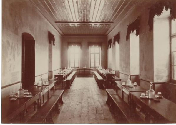
Resim 6: Yanya Hamidiye İnas Rüştiye Mektebinin Birinci Katında Yer Alan Taâm-hâne (Yemek Salonu) 49

Benjamin C. Fortna'nın yaptığı araştırmalar neticesinde o dönem itibariyle kullanım mahallinde okul haritalarının fotoğraflanmış tek örneği Yanya'daki kız rüştiye okuluna ait fotoğraflardır. Okulun farklı dershanelerine ait fotoğraflar bulunmaktadır. Fotoğraflarda yüksek öğretmen kürsüsüne dönük nizami sıralar ve sandalyeler görülmekte, her derslikte başka bir harita bulunduğu görülmektedir. Mevcut fotoğraflarda resmedilen kıta haritaları İstanbul Üniversitesi harita koleksiyonunda halen mevcut olan haritalardandır. 50