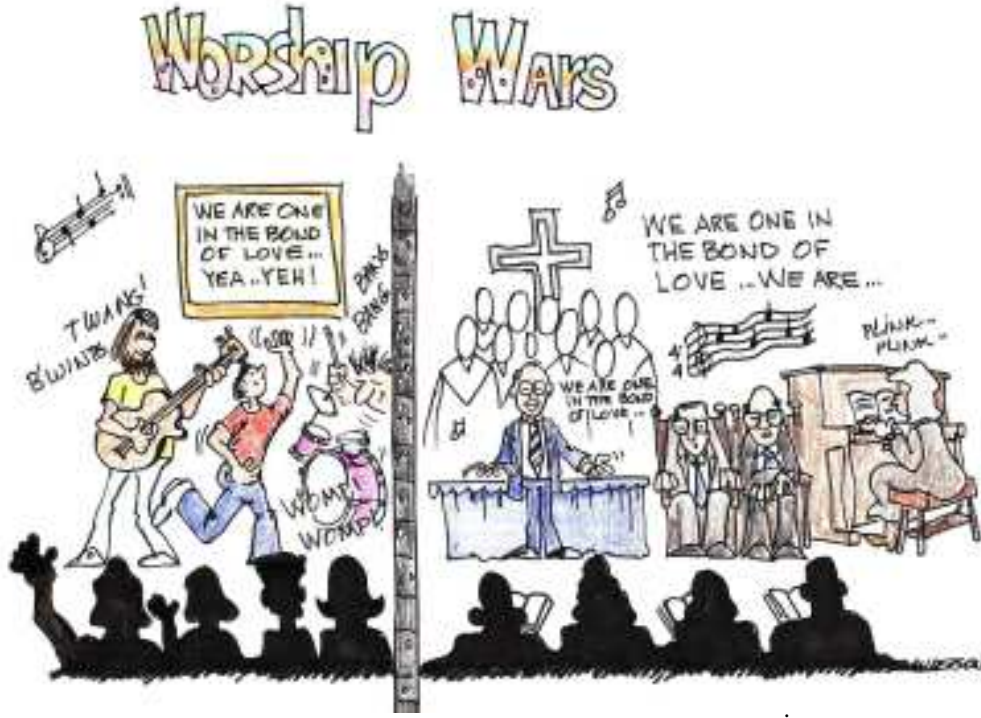
Resim 01. "Tapınma Savaşlarını" ( Worship Wars ) temsil eden karikatür.