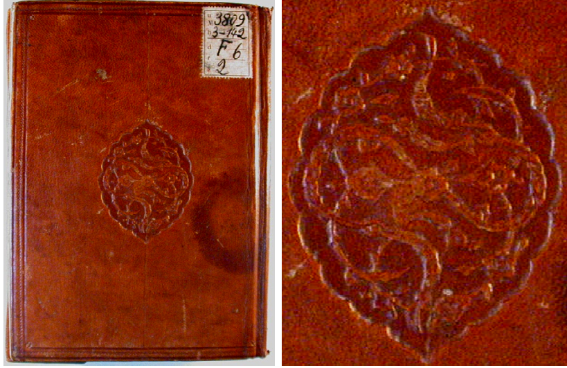
Fotoğraf 8. "Feyz el-Kadir Şerh-i el-Cami el-Sagır" isimli esere ait deri cilt kapağı

Fotoğraf 9'da, 17. yüzyıla tarihlendirilen ve "Feyz el-Kadir Şerh-i el-Cami el-Sagır" şeklinde isimlendirilen yazma esere ait cilt kapağı görülmektedir. Yazma eser cildinin ait olduğu dönem bilinmemektedir. Yazma eser cildinin yapımında kızıl kahve renkli meşin deri kullanılmış ve cilt kapağı üzerinde "Soğuk Şemse" tekniği uygulanmıştır. Cilt kapağının merkezinde oval şemse bulunmaktadır. Oval şemse içerisinde ağırlıklı olarak bulut motifi (sembolik motif) uygulanmakla beraber hatai , penç , saz yolu yaprak , hançeri yaprak ve kıvrımlı dal motiflerinin de (bitkisel motifler) kullanılmasıyla motif kompozisyonu oluşturulmuştur. Cilt kapağının kenarlarının yıldız kullanılmadan iki sıra cetvel çekilmek suretiyle çevrelendiği görülmektedir. Yazma Eserler Kurumu arşiv numarası "42 Yu 149" dur.