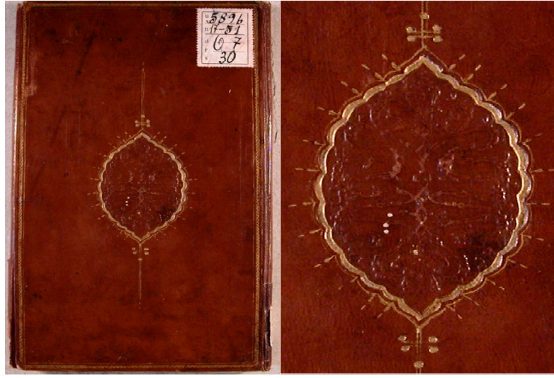
Fotoğraf 7. “ Risâle fî Tahkîki Lafzi'l-Çelebî ” isimli esere ait deri cilt kapağı

Fotoğraf 7’de, “ Risâle fî Tahkîki Lafzi'l-Çelebî ” şeklinde isimlendirilen ve 16. yüzyıla tarihlendirilen ve yazma esere ait cilt kapağı görülmektedir. Yazma eser cildinin ait olduğu dönem bilinmemekle sözü edilen tarihlendirme sadece yazma eserin ait olduğu dönemi nitelemektedir. Yazma eser cildinin yapımında kızıl kahve renkli meşin deri kullanılmış ve cilt kapağı üzerinde “Soğuk Şemse” tekniği uygulanmıştır. Cilt kapağının merkezinde oval şemse bulunmaktadır ve oval şemse içerisinde bulut motifinin (sembolik motif) uygulanmasıyla oluşturulmuş motif kompozisyonu görülmektedir. Oval şemsenin dandanlı kenarları yıldız kullanılarak süslenmiş ve aynı zamanda yıldız ile tığ motifi (yardımcı motif) uygulanarak bezenmiştir. Oval şemsenin alt ve üst kısmında ise yıldız ile uygulanmış nokta motifli (yardımcı motif) salbek uzantıları görülmektedir. Cilt kapağı bir sıra ince bordür ile çevrelenmiş, bordür içerisinde zencerek motifi (geometrik motif) uygulanmış ve yıldız ile renklendirilmiştir. Söz konusu eserin, Yazma Eserler Kurumu arşiv numarası “42 Yu 4893/40”dir.