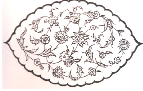
Şekil 1. Oval Şemse (Özcan, 1990, 24)