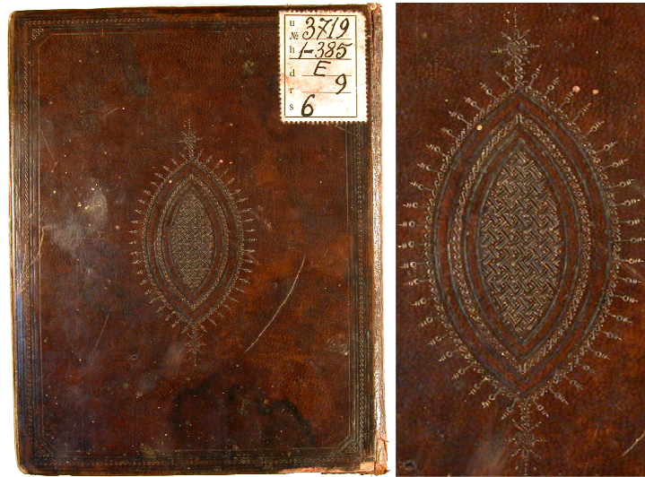
Fotoğraf 4. "Haşiye-i Tifrisi Keşşaf" isimli esere ait deri cilt kapağı

Fotoğraf 4'te, "Haşiye-i Tifrisi Keşşaf" şeklinde isimlendirilen yazma esere ait cilt kapağı görülmektedir. Yazma eserin ve yazma eser cildinin ait olduğu dönem bilinmemektedir. Yazma eser cildi üzerinde görülen şemse formu ve şemse içerisinde bulunan motif kompozisyonu Anadolu Selçuklu Dönemi cilt üslubunu anımsatmaktadır. Yazma eser cildinin yapımında açık kahve renkli meşin deri kullanılmış ve cilt kapağı üzerinde "Soğuk Şemse" tekniği uygulanmıştır. Cilt kapağının merkezinde mekik biçiminde şemse uygulanmış ve şemse içerisinde geçme motifi (geometrik motif) uygulanarak motif kompozisyonu oluşturulmuştur. Mekik biçiminde şemsenin alt ve üst kısmında düğümlü geçme (geometrik motif) motifinin uygulanmasıyla oluşturulmuş salbek uzantıları görülmektedir. Cilt kapağı bir sıra ince bordür ile çevrelenmiş ve bordür içerisinde zencerek motifi (geometrik motif) uygulanmıştır. Yazma Eserler Kurumu arşiv numarası "42 Yu 88" dir.