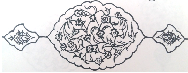
Şekil 2. Salbekli Şemse (Özcan, 1990, 21)

Bu çalışmaya konu teşkil eden ve çalışma kapsamında incelenen deri ciltler üzerinde tespit edilen "Soğuk Şemse" tekniği; "hazırlanan şemse kalibinin yıldız kullanılmadan doğrudan doğruya cildin üzerine basılması" şeklinde uygulanmaktadır. Özellikle 15. yüzyıla kadar bütün İslam ciltleri bu şekilde yapılmış, şemse içerisinde uygulanmış olan motifler yıldız kullanılmadan derinin kendi renginde bırakılmıştır (Fotoğraf 1) (Özen, 1985, 64; Binark, 1975,11). "Soğuk Şemse" tekniği uygulanarak yapılmış deri ciltler incelendiğinde; şemse, salbek şemsesi, miklep şemsesi ve köşebentlerin dendanlı kenarlarının yıldız ve "nokta-tığ" motifleri (yardımcı motif) ile süslediği örneklerle de rastlanmaktadır (Fotoğraf 2).