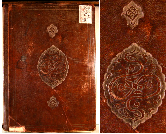
Fotoğraf 5. "İnayetü'l-Kâdî ve Kifayetü'r-Râzî" isimli esere ait deri cilt kapağı

Fotoğraf 5'te, "İnayetü'l-Kâdî ve Kifayetü'r-Râzî" şeklinde isimlendirilen ve 17. yüzyıla tarihlendirilen ve yazma esere ait cilt kapağı görülmektedir. Yazma eser cildinin ait olduğu dönem bilinmemekle beraber yukarıda verilen tarih bilgisi sadece yazma eserin ait olduğu dönemi nitelemektedir. Yazma eser cildinin yapımında kırmızı kahve renkli meşin deri kullanılmış ve cilt kapağı üzerinde "Soğuk Şemse" tekniği uygulanmıştır. Cilt kapağının merkezinde oval şemse bulunmaktadır. Oval şemse içerisinde ağırlıklı olarak bulut motifi (sembolik motif) uygulanmakla beraber hatai , goncagül , hançeri yaprak , yaprak ve kıvrımlı dal motiflerinin de (bitkisel motifler) kullanılmasıyla motif kompozisyonu oluşturulmuştur. Oval şemsenin alt ve üst kısmında salbek şemsesi uygulanmış ve salbek içerisinde hatai motifi (bitkisel motif) kullanılmıştır. Yazma Eserler Kurumu arşiv numarası "42 Yu 5165" dir.