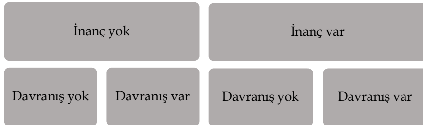
Şekil 2 : İstihare ile ilgili Bulgular

Katılımcıların istihare ile ilgili inanç ve uygulamalarını dört kategoride inceleyebiliriz: